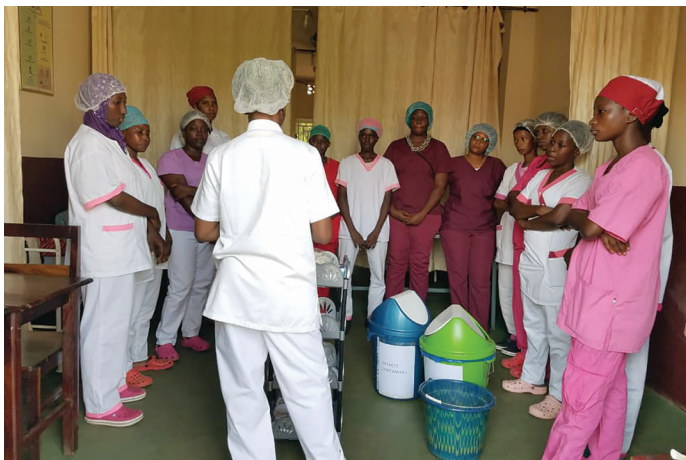
Réunion du personnel du centre de santé