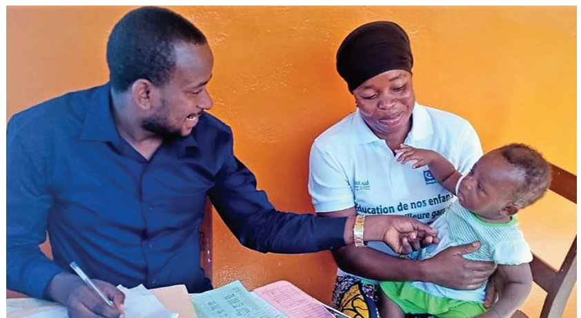
Validation des données au Centre de Santé

L'équipe d'évaluation du projet HEARD a examiné les performances du projet HSD au cours des 3,75 premières années de mise en œuvre, en utilisant l'approche de la recherche de mise en œuvre. En septembre 2019, l'équipe d'évaluation s'est rendue en Guinée pour une visite de cadrage. Des réunions avec les partenaires et les parties prenantes ont permis de définir les objectifs finaux de l'évaluation.